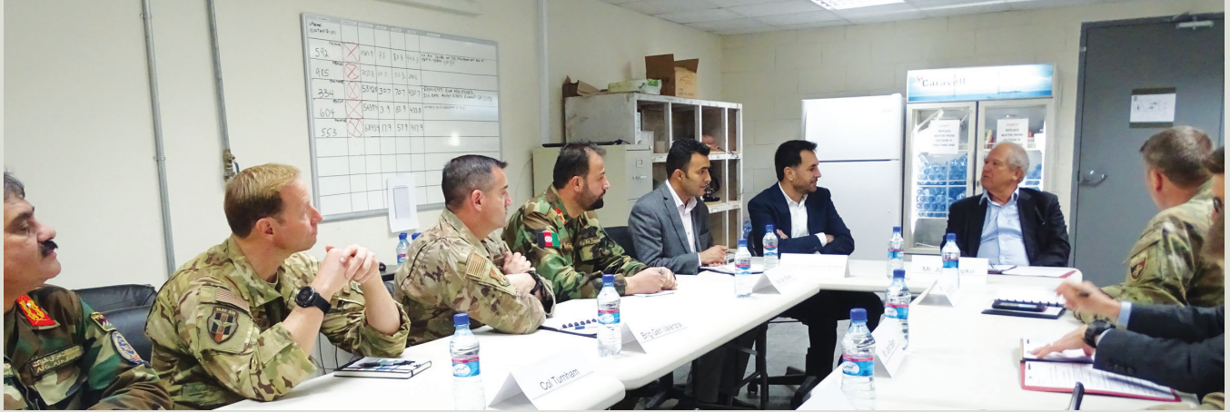
سرمفتش خاص ساپکو، در صدر میز دست راست، در حال صحبت کردن با اسدالله خالد، سرپرست وزارت دفاع افغانستان.