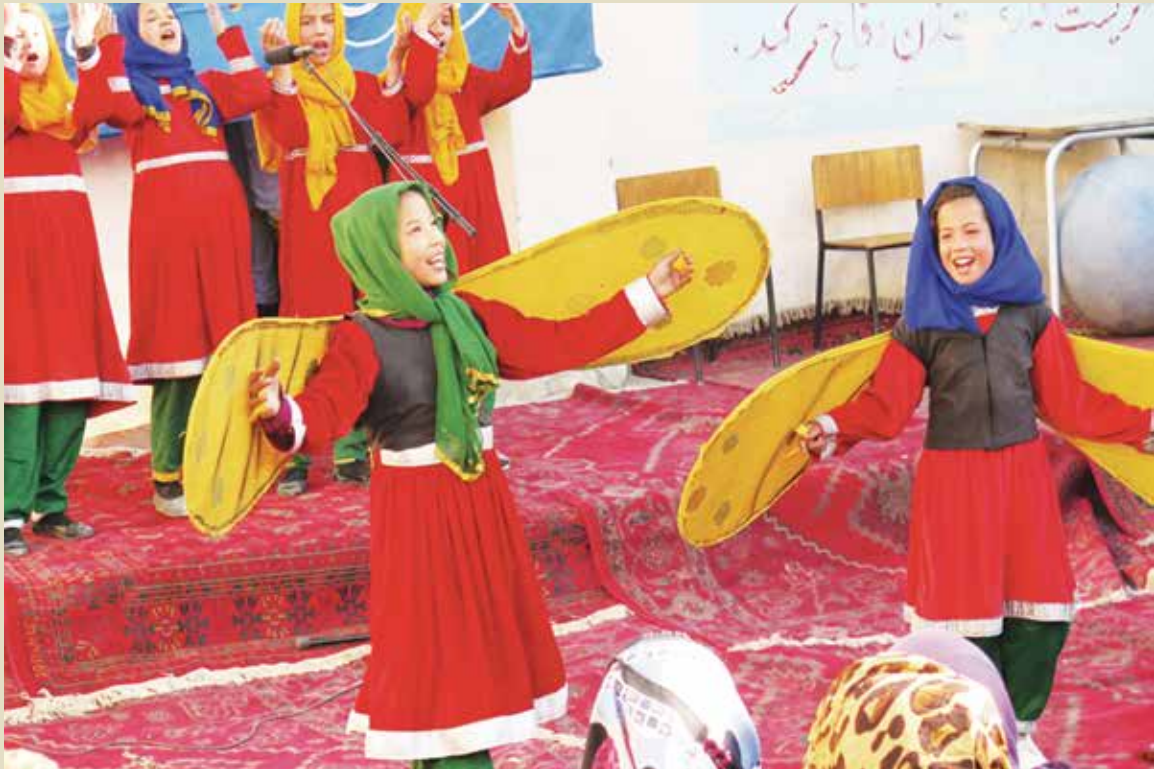
اعضای سرکس تعلیمی کودکان افغانستان به حمایت از یک برنامه ملل متحد برای جلوگیری از خشونت خانوادگی روی جاده نمایش اجرا میکنند.