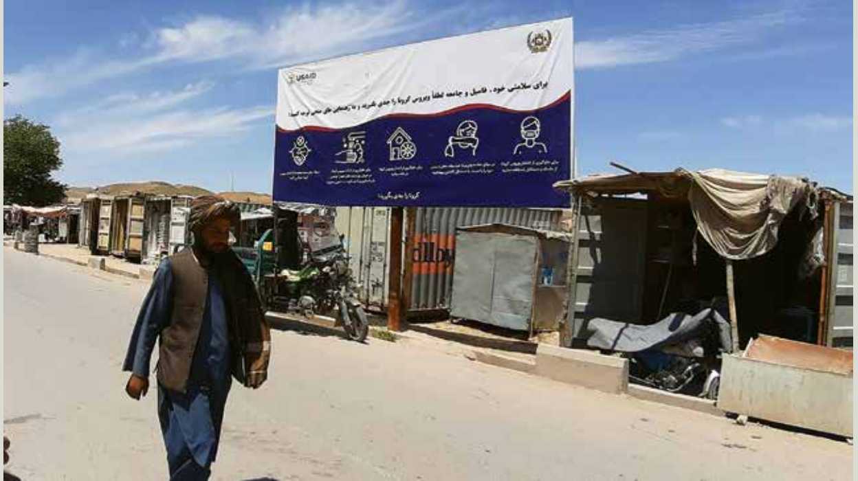
ادارات محلی در افغانستان برای توسعه‌ی آگاهی عامه در مورد روش‌های مطلوب برای جلوگیری از گسترش کوید-۱۹، از کمپاین‌های رسانه‌های جمعی، به شمول تخته‌های اعلانات (بیل‌بورد)، کار می‌گیرند.