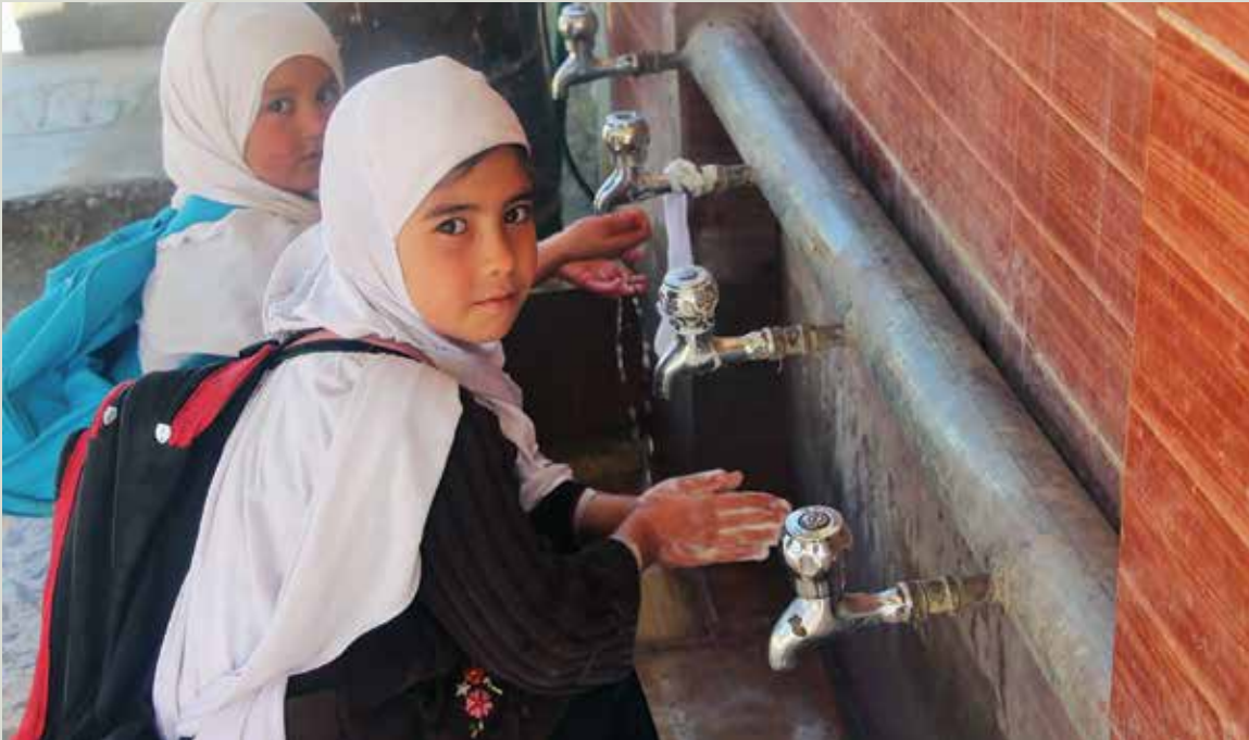
دختران افغان پس از بازگشایی مکاتب دست های خود را برای حفاظت در مقابل کوید-۱۹ می شویند.

از او آخر ماه جولای، دولت ایالات متحده، از طریق وزارت امور خارجه و اداره ایالات متحده برای انکشاف بین المللی، بیش از ۳۶.۷ میلیون دالر کمک های مالی در ارتباط با کوید در اختیار افغانستان قرار داده است و به پرداخت ۹۰ میلیون دالر کمک حمایتی بانک جهانی سرعت بخشیده است تا در پشتیبانی از سکتور آموزش و پرورش و امور صحتی مورد استفاده قرار گیرد. ۶۲ در میانه ماه اسد، اداره کمک های بشری اداره ایالات متحده برای انکشاف بین المللی، ۱۲ میلیون دالر دیگر به پروگرام غذای جهانی ملل متحد برای پشتیبانی از امداد اضطراری غذا برای ۹۵۰۰۰ خانواده های که مصونیت غذایی نداشتند، فراهم نمود. ۶۳