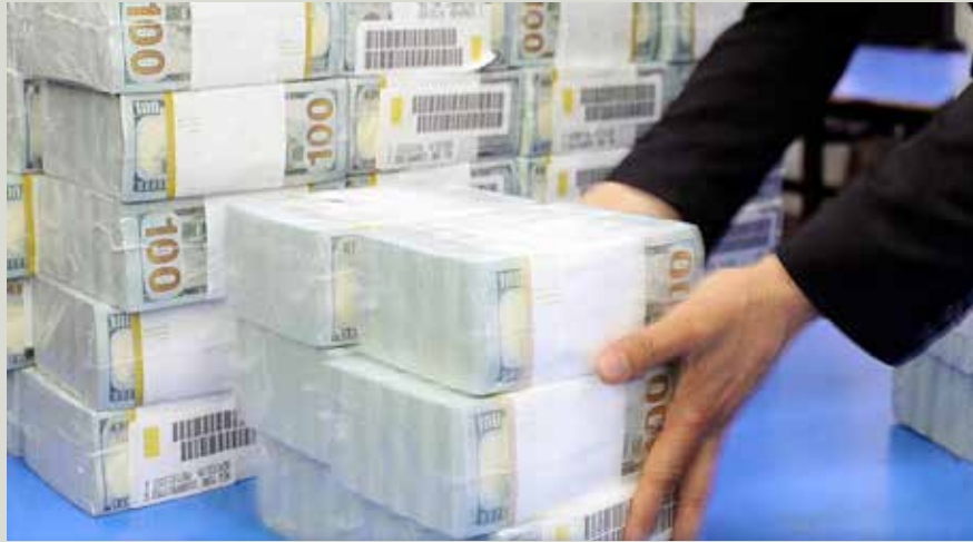
انتقال پول نقد به یک بانک تجاری در کابل به منظور کمک های بشردوستانه در ماه اکتوبر

مالی وجود دارد. طالبان همچنین افراد وفادار خویش را در نقش های رهبری د افغانستان بانک تعیین کرده اند، از جمله تعیین فردی به حیث معاون بانک که از سوی سازمان ملل متحد به دلیل نقشش به عنوان یک رهبر جنگجوی طالبان تحریم شده است. ۹