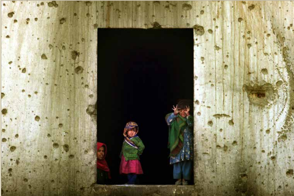
کودکان پناهنده افغان از پنجره سرپناه خود در تعمیر سفارت شوروی سابق که یک محوطه عظیم در میان ویرانی های غرب کابل است، به بیرون نگاه می کنند.