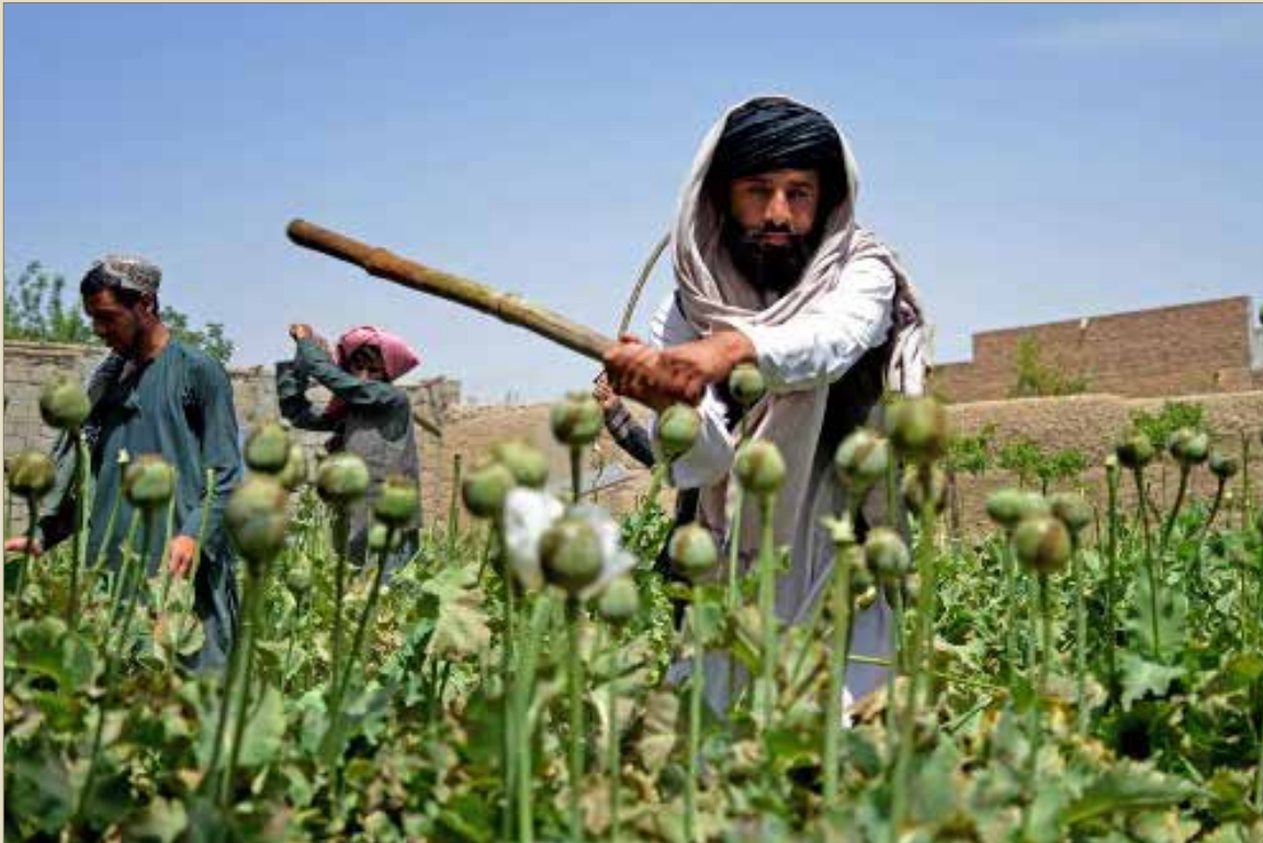
منسویین امنیتی طالبان چین تخریب یک مزرعه خشخاش در ۱۱ اپریل ۲۰۲۳ در قندهار.