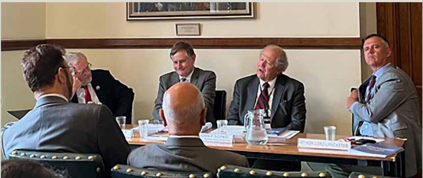
سرمفتش جان ساپکو، حین سخنرانی در کنار جان اسپلر، عضو پارلمان (سمت چپ)، سریو بیلی، کمیسار کمیسیون مستقل بررسی موثریت کمک ها (چپ)، و لورد مارک لنکستر (سمت راست) در مجلس به میزبانی کمیسیون مستقل بررسی موثریت کمک ها در لندن، ۲۰۲۳/۱۰/۷.

کمیسیون مستقل بررسی موثریت کمک های بریتانیا یا ICAI یک اداره حکومتی بریتانیا بوده و شبیه سیگار است. این اداره صلاحیت دارد تا از کمک های انکشافی بریتانیا نظارت نموده و سفارشات خود را برای بهبود امور فراهم نماید. اداره سیگار از زمان تعیین سرمفتش ساپکو در سال ۲۰۱۲ به این سو با اداره ICAI همکاری نزدیک داشته است. یک خلاصه ای از درس های آموخته شده ICAI در ضمیمه H این گزارش ربع وار آمده است. نتایج یافته های گزارش ICAI بسیار شبیه به نتایجی است که در ۱۲ گزارش تجارب